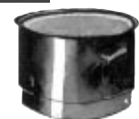
Salaojakaivon jatkomoduuleja 315 mm