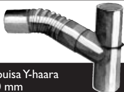
Taipuisa Y-haara 110 mm