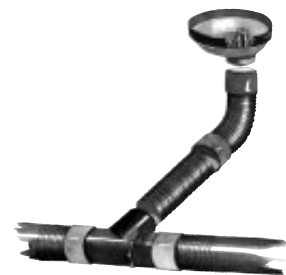
Sadevesisiili 315 mm/100 mm