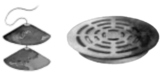
Jäätymis- suojat 315 mm Sadevesikaivon ritiläkansi 315 mm