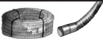
Taipuisat sadevesiputket kierreinä tai salkoina 100 ja 110 mm