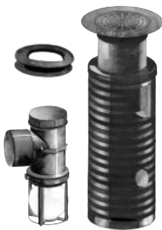
Läpivienti- tiivistekumeja Pallopadotus- venttiili