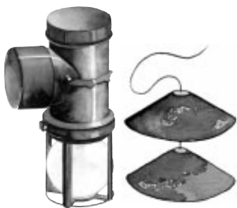
Pallopadotusventtiili 110 mm