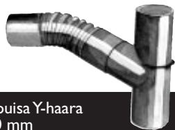
Taipuisa Y-haara 110 mm